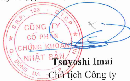
Tsuyoshi Imai Chủ tịch Công ty

(Ký tên, ghi rõ họ tên, chức vụ, đóng dấu)